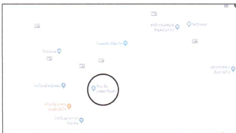
ภาพแสดงแผนที่ตั้งวิทยาลัยเทคนิคเชิงคำ

เนื้อที่ของสถานศึกษา 62 ไร่ 2 งาน 7 ตารางวา